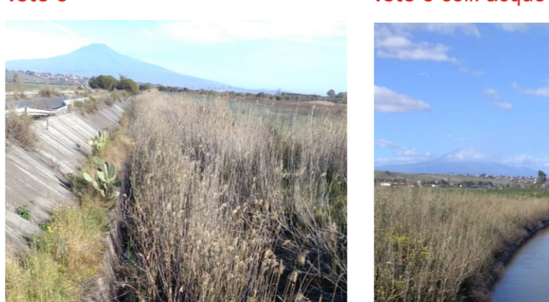
foto 5 coll. acque basse nord