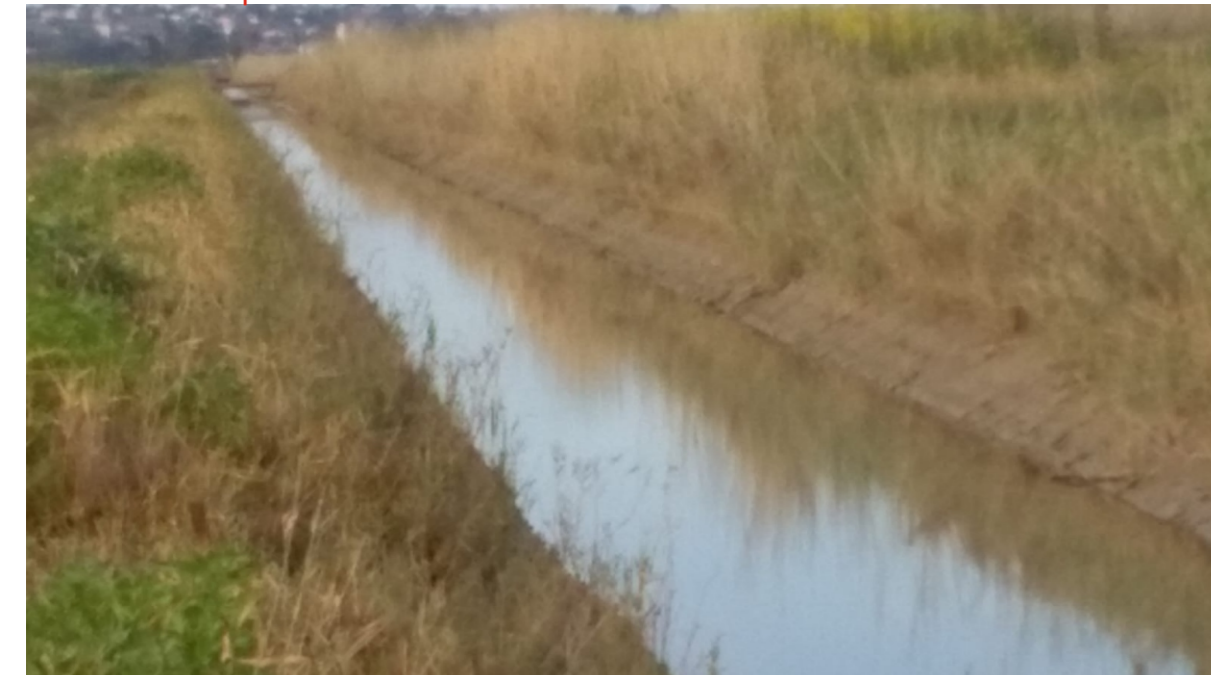
foto 6 canale del gurgio